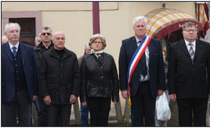
* Extraits du message de M. TODESCHINI, Secrétaire d'Etat auprès du Ministre de la Défense, chargé des anciens Combattants et de la Mémoire.