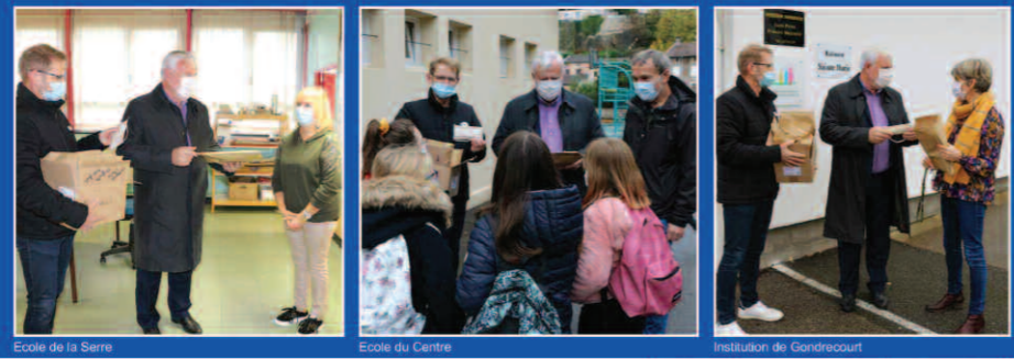
Réception des masques par les directeurs d'école

A noter que les adultes qui auraient besoin de masques supplémentaires peuvent toujours en faire la demande en mairie au 03.83.76.35.35, à raison d'un masque par personne, selon le stock disponible.