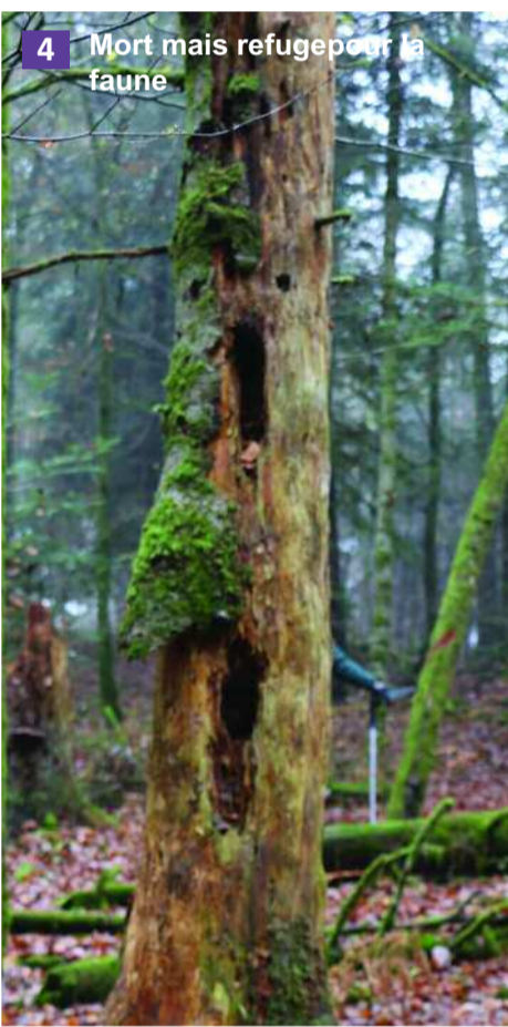
4 Mort mais refuge pour la faune