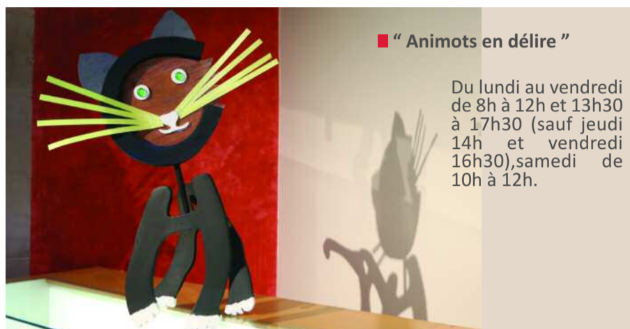
■ " Animots en délire "

Avec ces « animots en délire » et funambulesques, cette exposition se veut ludique et poétique, pédagogique aussi, avec une mise en scène farfelue des mots, affirmée par l'artiste. Avec cette arche de Noé, venez jouer les spéléologues de la langue française, régalez-vous, amusez-vous à l'Hôtel de ville en cette fin d'année 2017 !