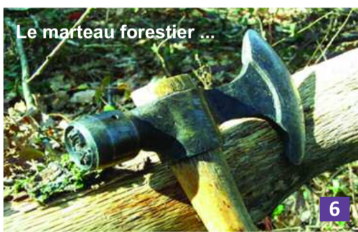
Le marteau forestier ...