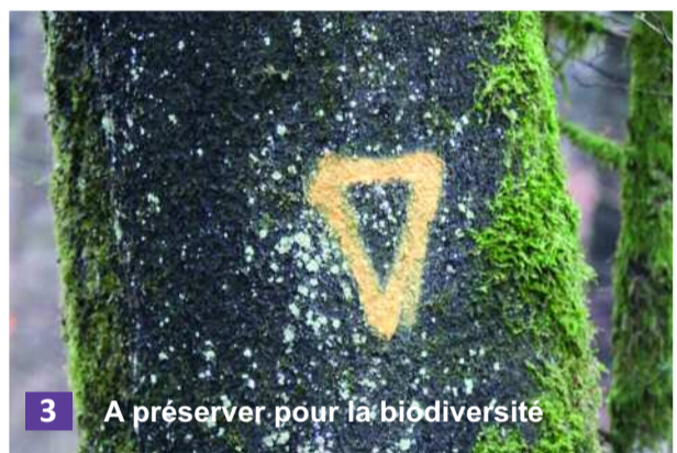
3 A préserver pour la biodiversité