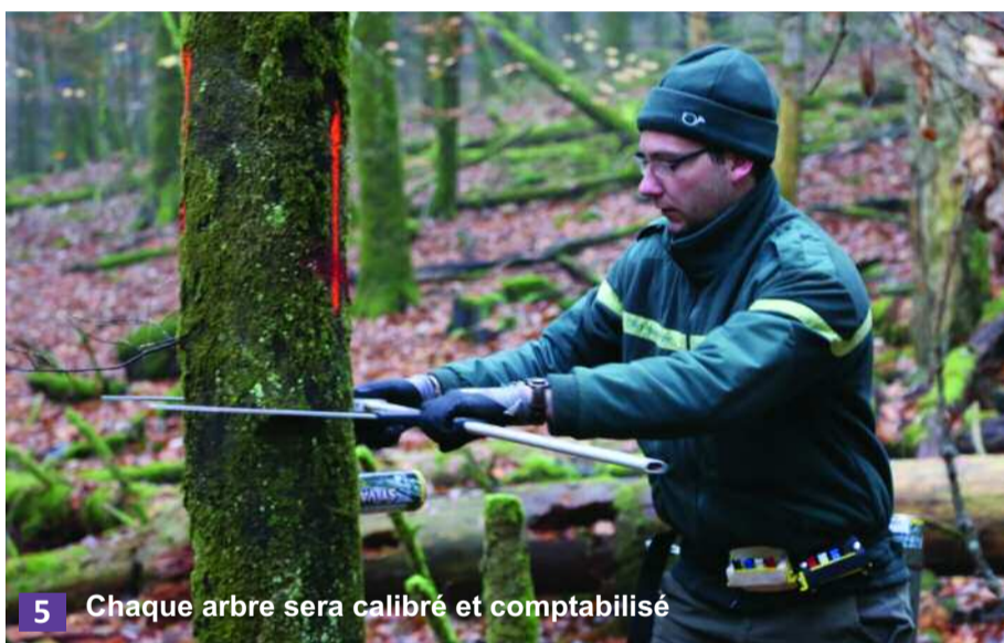
5 Chaque arbre sera calibré et comptabilisé