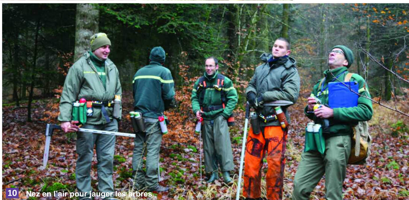
10 Nez en l'air pour jauger les arbres