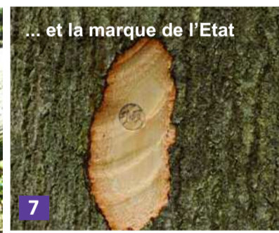
... et la marque de l'Etat