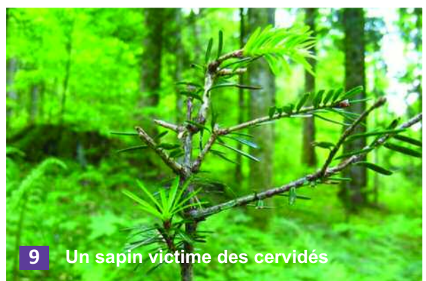
9 Un sapin victime des cervidés