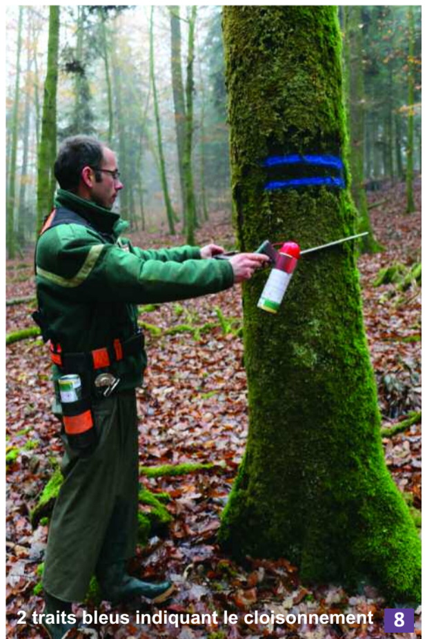
2 traits bleus indiquant le cloisonnement 8