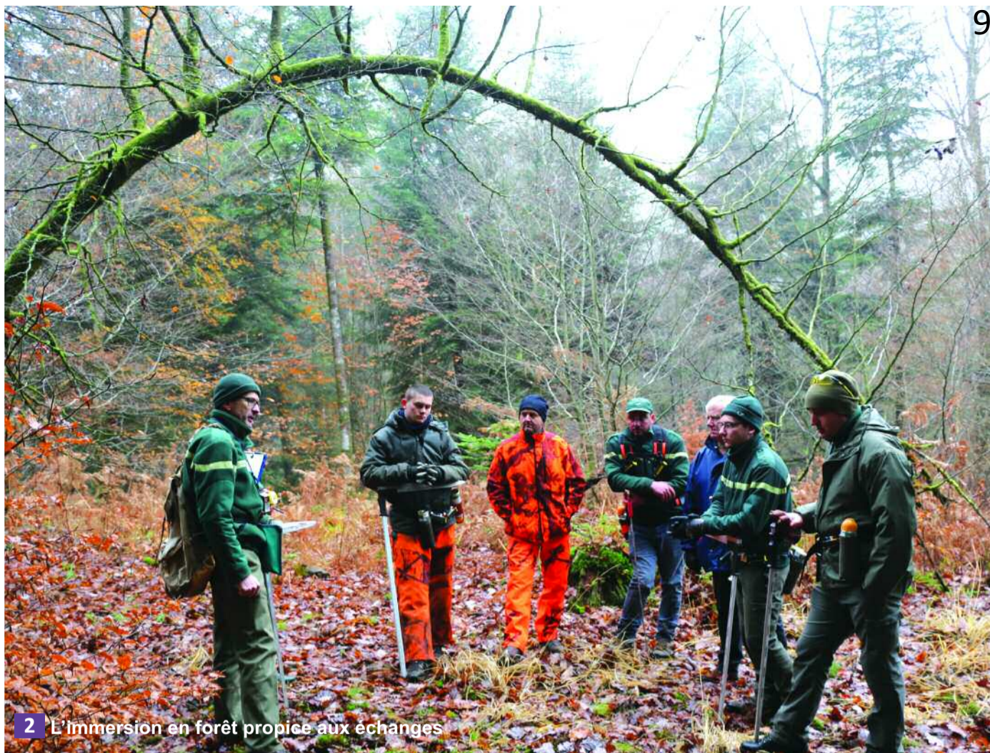
2 L'immersion en forêt propice aux échanges