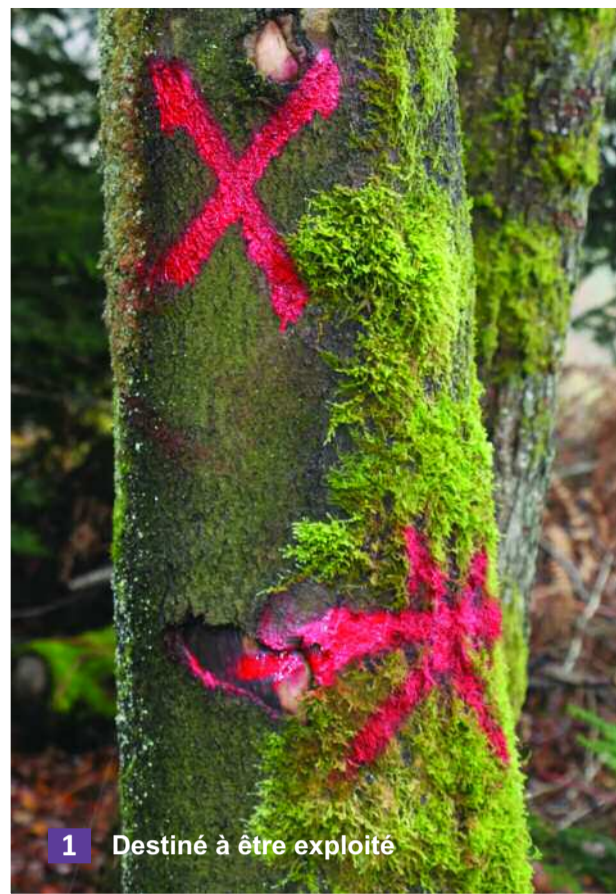
1 Destiné à être exploité