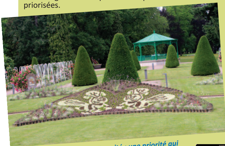
Préservation de la biodiversité : une priorité qui se retrouve symbolisée par ces deux bourdons qui pollinisent le parc Michaut.

Le choix des plantes est orienté pour une production à froid : la température des serres est juste maintenue à 3 ou 4 degrés et les plantes adaptées au climat local priorisées.