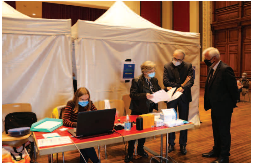
Sous-Préfet et maire se concertent avec le personnel médical

Ce service est gratuit pour se rendre dans un centre de vaccination du territoire, mais il faut contacter les services au minimum trois jours avant au 0800.607.062. Appel gratuit, ouvert du lundi au samedi de 8h à 18h.