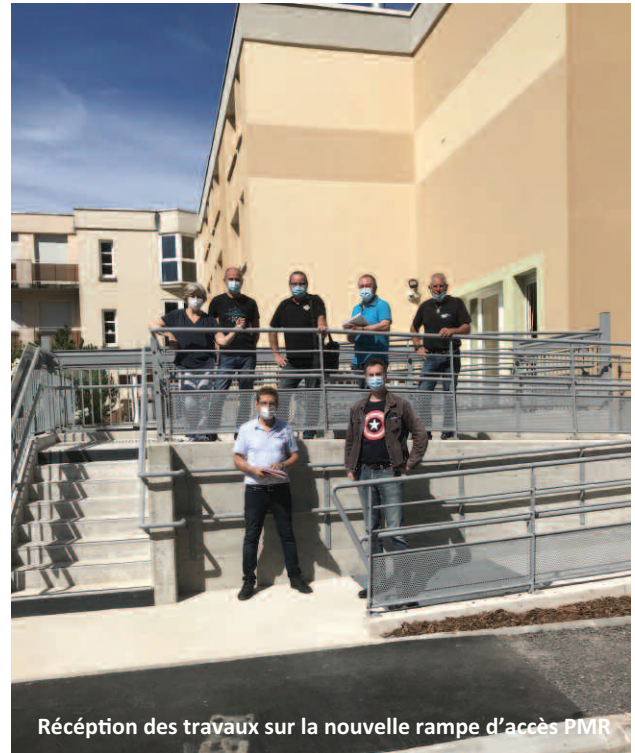
Réception des travaux sur la nouvelle rampe d'accès PMR